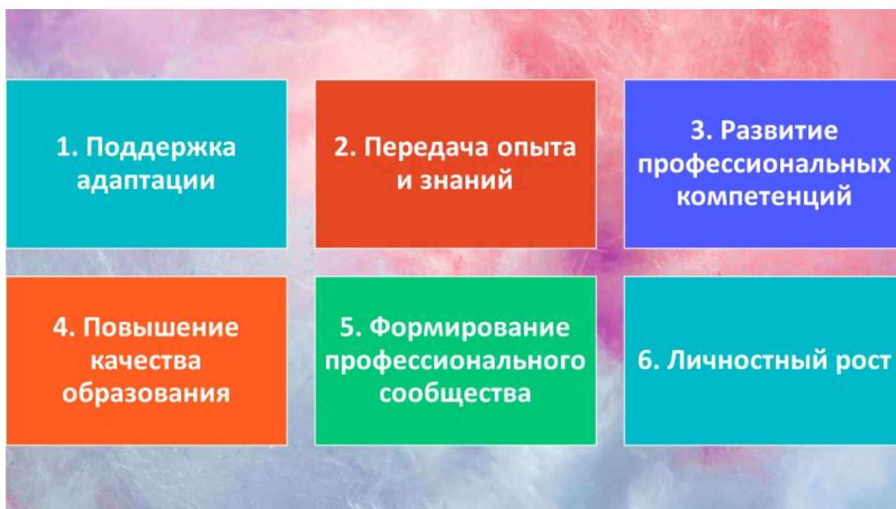
Рис. 1 – Аспекты наставничества

Наставничество складывается из ряда аспектов (см. рисунок 1)