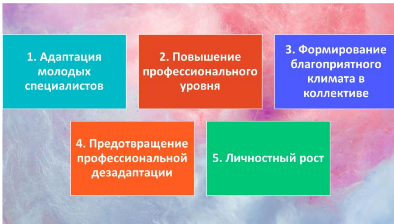
Рис. 4 – Цели наставнической деятельности с учителями, начинающими работу в летнем оздоровительном лагере

Кроме того, сразу после окончания учебного года я трудилась в летнем оздоровительном лагере при школе. Так как у меня уже накоплен существенный опыт работы в данном направлении, я сразу определилась с основными целями наставничества для тех учителей, которые только начинают работу в летних оздоровительных лагерях (см. рисунок 4)