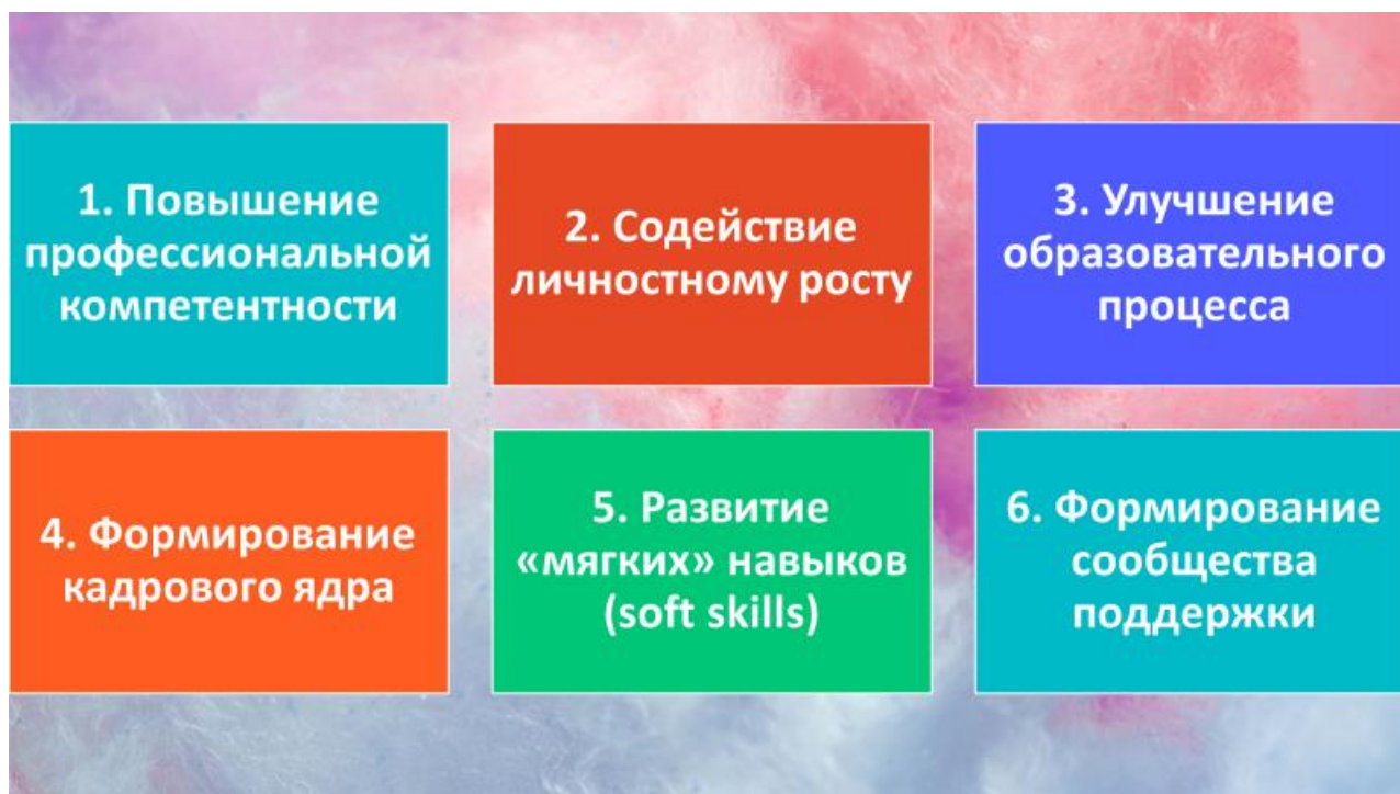
Рис. 2 – Цели наставнической деятельности

У наставничества не одна, а несколько целей (см. рисунок 2)