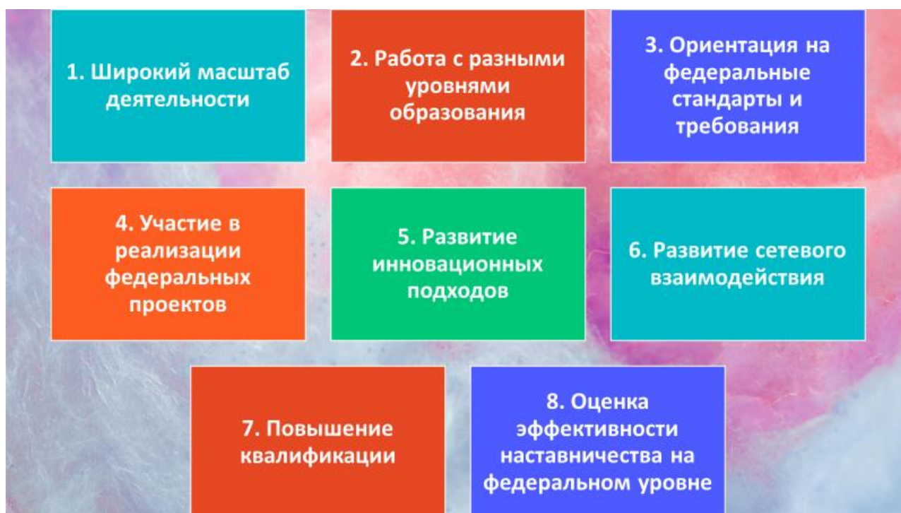
Рис. 3 – Особенности работы наставника федерального уровня

Наставник работает с педагогами, представляющими различные регионы и образовательные организации, что требует учета специфики каждой из них.