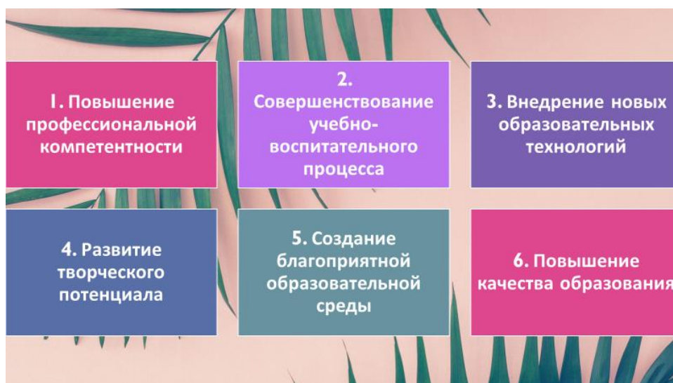
Рис. 3 – Профессиональные возможности, обеспеченные участием в работе методического объединения учителей иностранных языков

Лично для меня участие в работе методического объединения учителей иностранных языков имеет большое значение, так как открывает ряд профессиональных возможностей (см. рисунок 3)