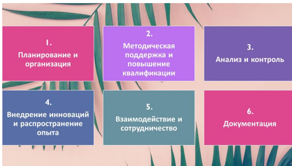
Рис. 5 – Функции руководителя методическим объединением учителей английского языка