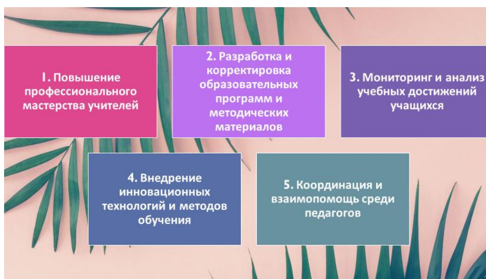
Рис. 1 – Задачи и функции методического объединения

Давайте проанализируем задачи и функции методического объединения и сделаем выводы о их необходимости (см. рисунок 1)