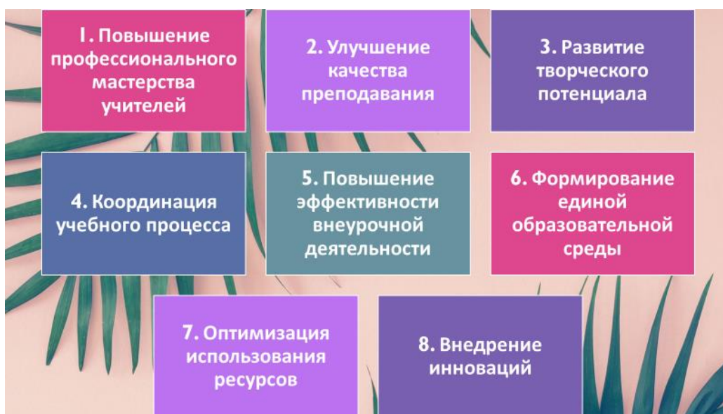
Рис. 2 – Преимущества, обеспеченные наличием в образовательной организации методического объединения

По перечню задач и функций, которое выполняет методическое объединение, ответ однозначен. Методическое объединение образовательной организации просто необходимо. Методическое объединение располагает рядом преимуществ (см. рисунок 2)