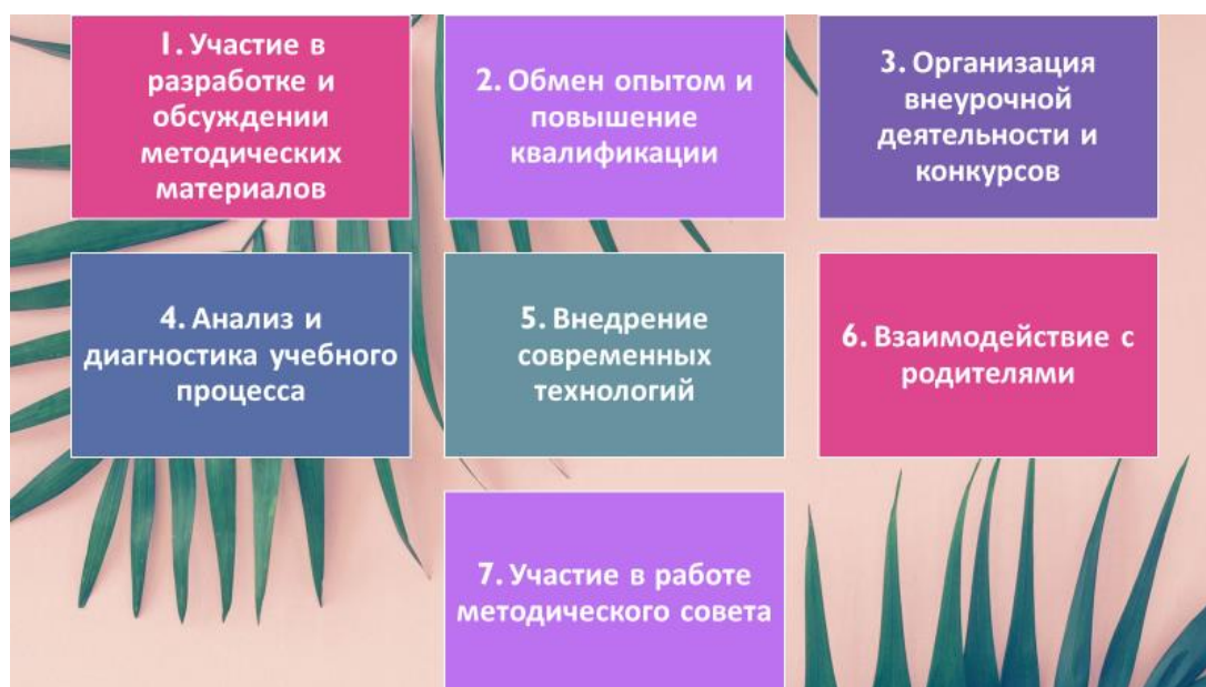
Рис. 4 – Основные направления деятельности методического объединения учителей иностранных языков

Являясь членом школьного методического объединения учителей иностранных языков, я принимаю участие в основных направлениях деятельности, обеспечивающих повышение качества образования на уровне СОО (см. рисунок 4)